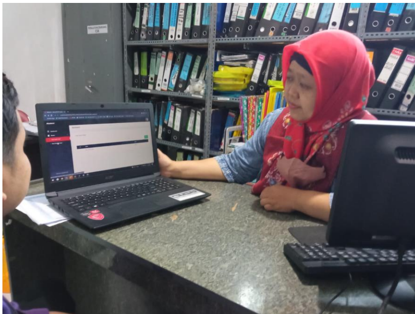
Gambar D.5 Diskusi Pembuatan Sistem Laporan keuangan