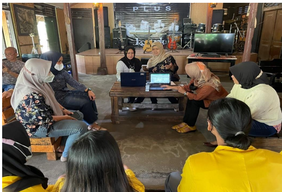
Gambar D.1 Pemberiaan Pelatihan Penyusunan Laporan keuangan