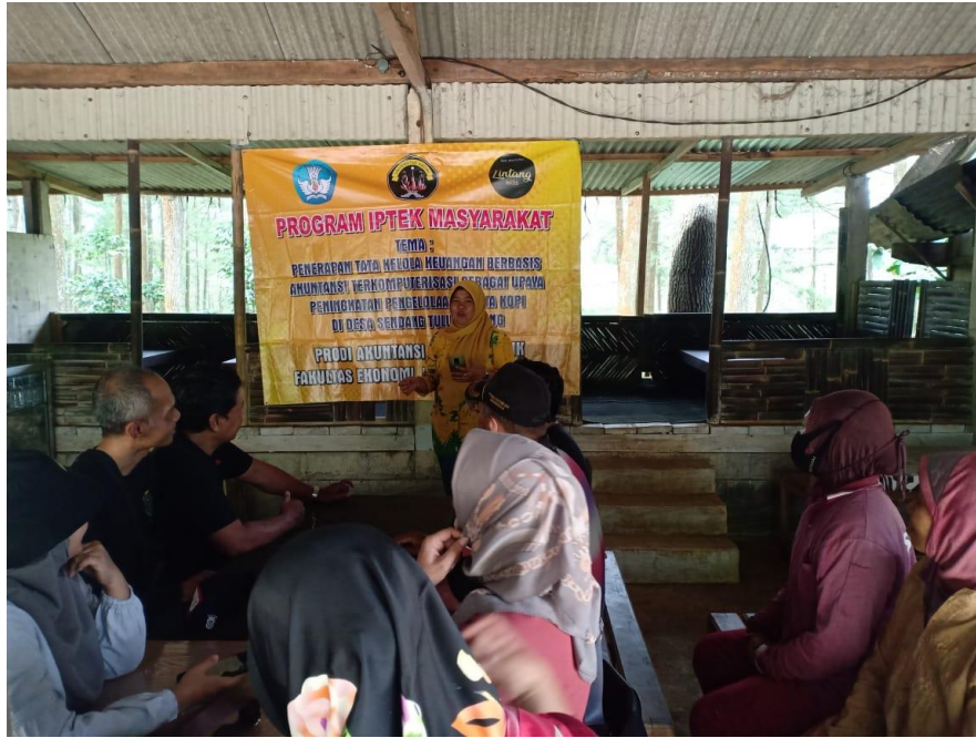
Gambar D.2 Pemberiaan Pelatihan MSDM