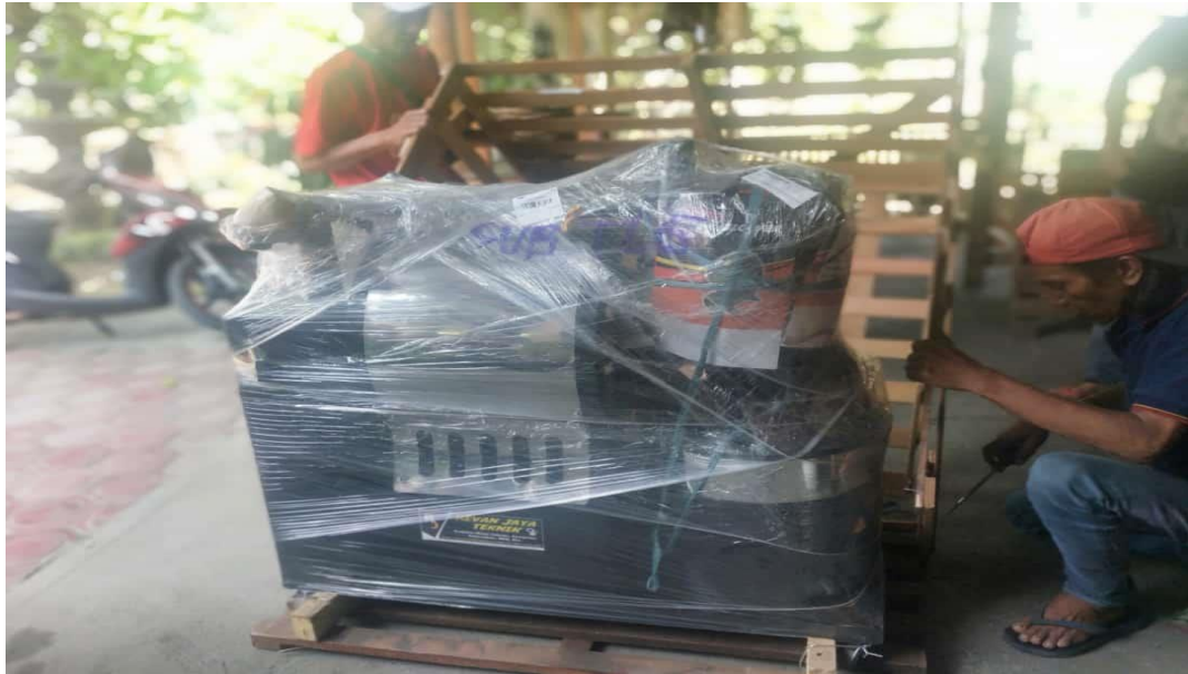
Gambar D.8 Mesin Penggorengan Kopi diterima Mitra