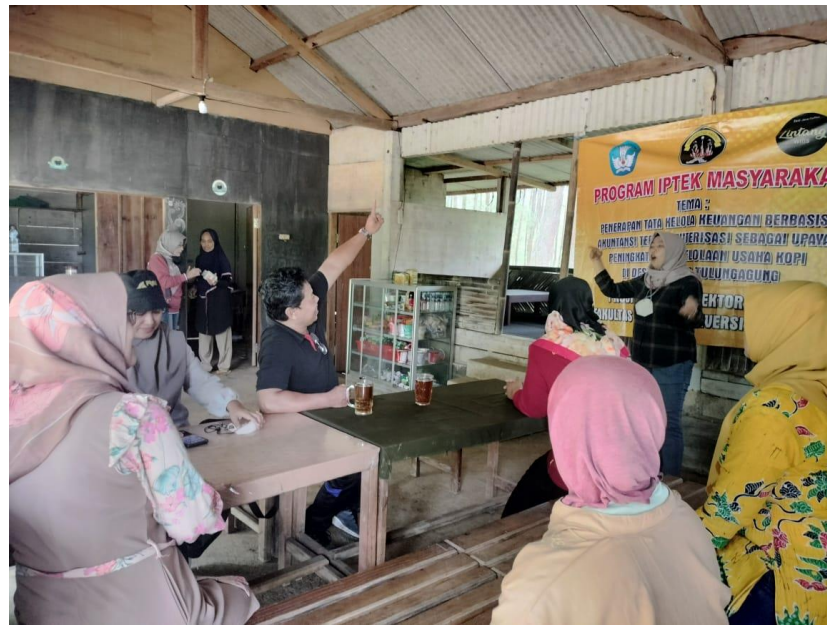
Gambar D.3 Pemberiaan Pelatihan Berwirausaha