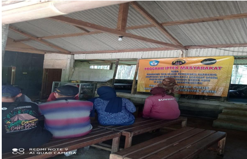
Gambar D.4 Pemberiaan Pelatihan Marketing Digital