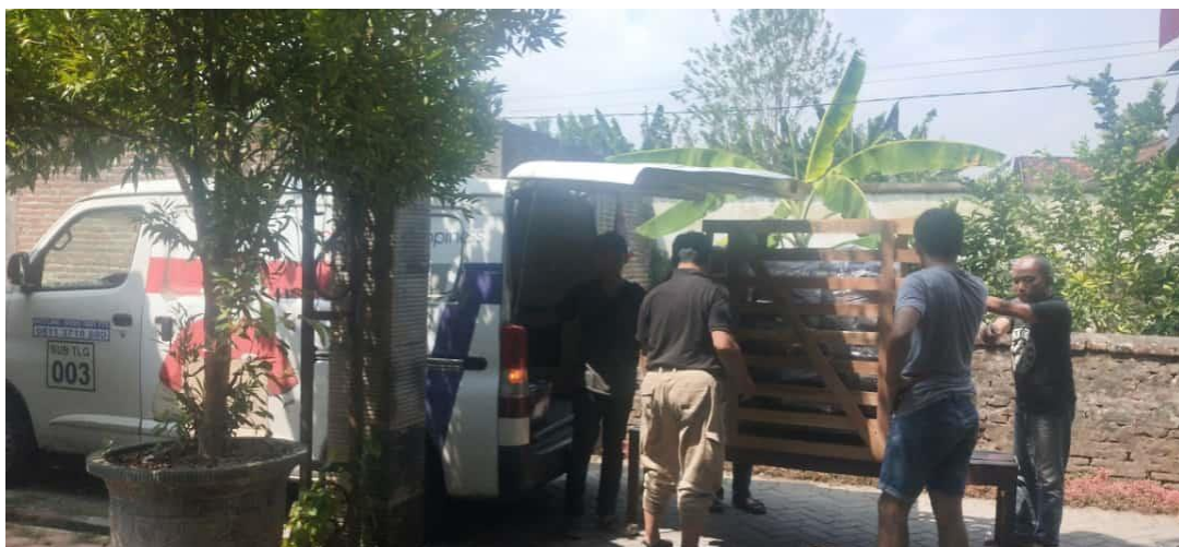
Gambar D.7 Pengiriman Mesin Penggorengan Kopi

Kemudian dalam mengatasi permasalahan selanjutnya yang dihadapi kedua mitra adalah membutuhkan alat Sangray kopi untuk mempercepat proses pengolahan kopi. Luaran dari solusi ini adalah pengadaan alat penggorengan baru dengan kapasitas memasak kopi yang lebih banyak. Dan diharapkan produksi yang dihasilkan semakin meningkat kuantitasnya dan berkualitas. Selain itu target luaran yang dihasilkan dari segi produksi peningkatan hasil produksi menjadi 70% dari produksi sebelumnya, bisa memenuhi pesanan warung kopi diwilayah tulungagung minimal 80% dari total warung kopi yang ada disekitar wilayah Tulungagung