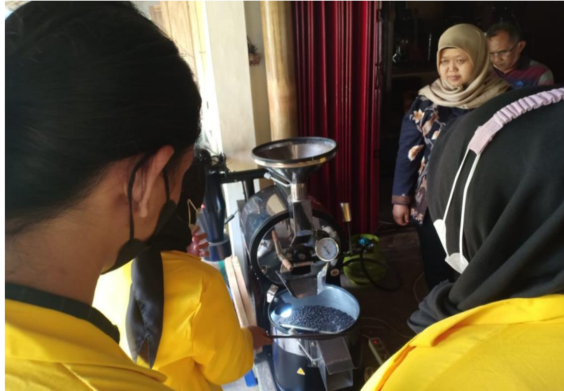
Gambar D.10 Uji Coba Mesin Penggorengan Kopi