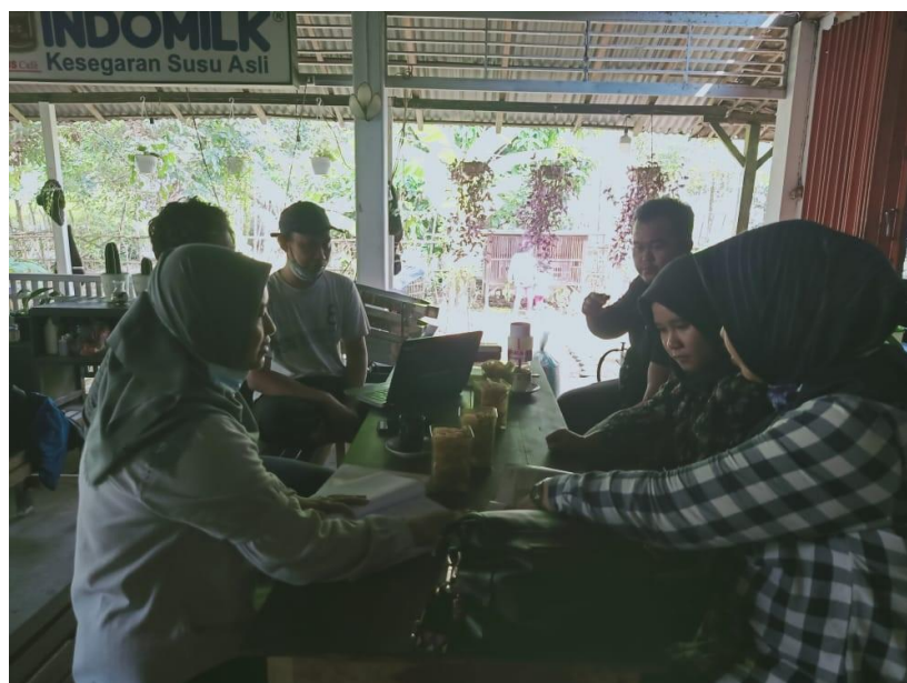
Gambar 1. Koordinasi Awal dengan Mitra