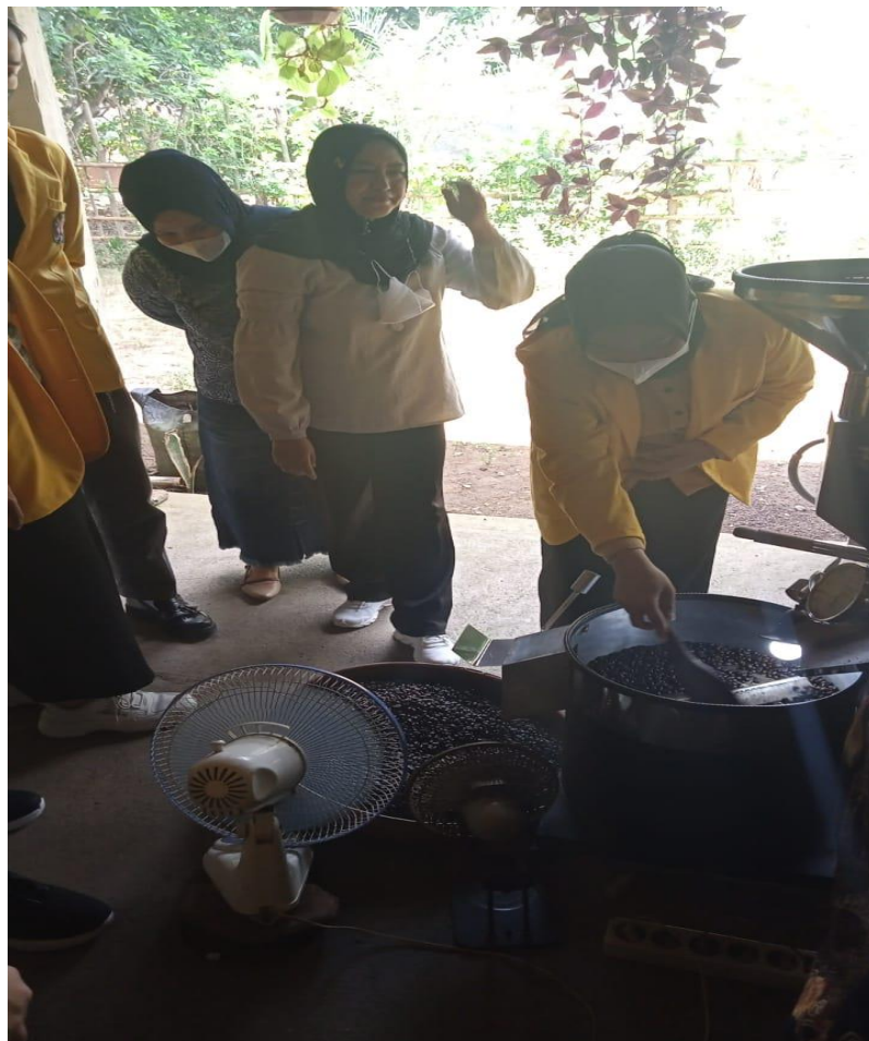
Gambar D.9 Uji Coba Mesin Penggorengan Kopi